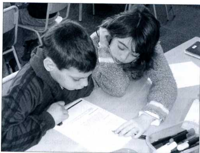
Tutoría entre iguales en la escuela Riera de Ribes